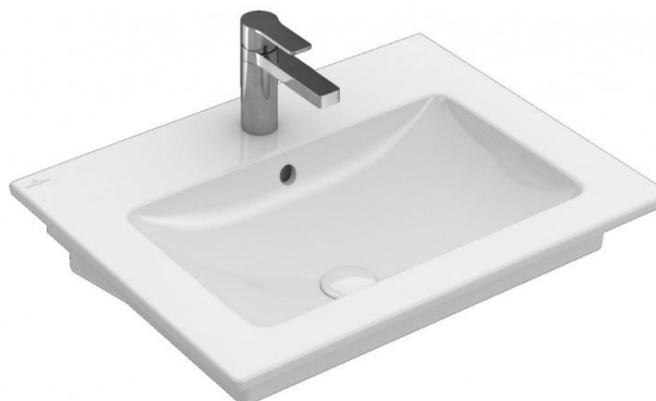
Umyvadlo Villeroy & Boch, Verity