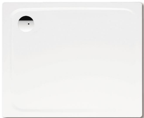
Vanička Kaldewei – obdelník (v apartmánech dle PD)