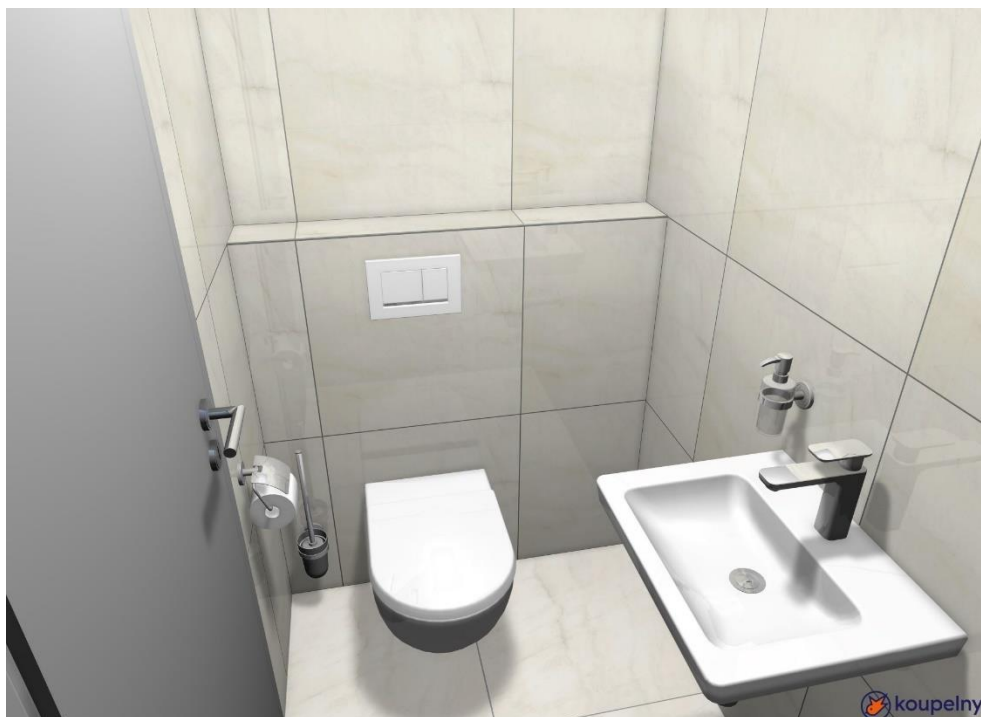
Ilustrační foto samostatné toalety