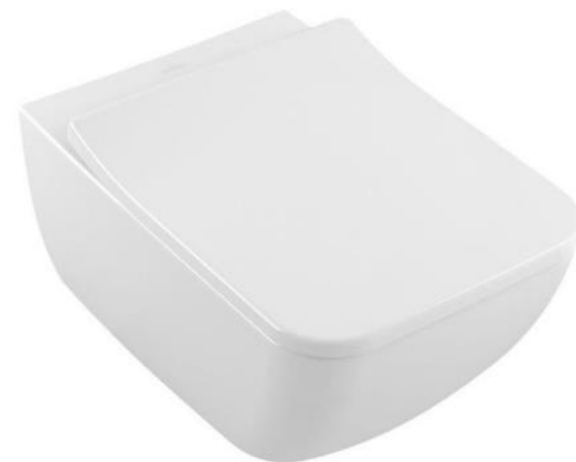
WC Villeroy & Boch, Venticello, Slimseat soft close