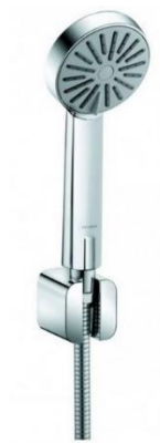
Sprchový set Kludi