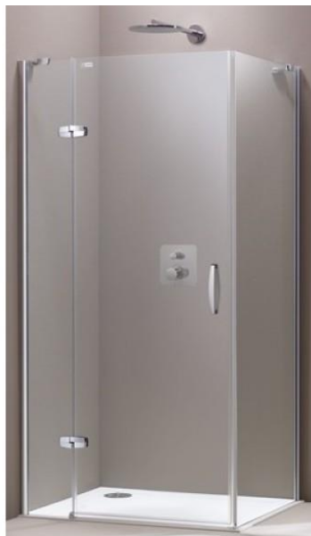
Hüppe Aura Elegance – sprchová zástěna, obdelník