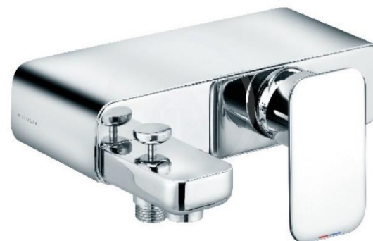
Kludi E2, podomítková baterie vanová (v apartmánech dle PD)