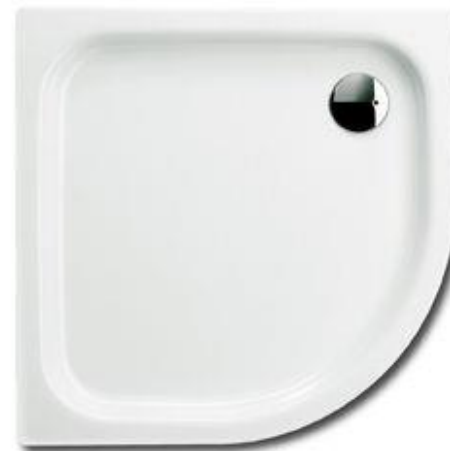
Vanička Kaldewei – čtvrtkruh (v apartmánech dle PD)